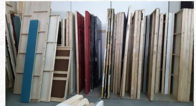
Feuilles décor répertoires stockées à la Ressourcerie du Cinéma

La feuille décor actuelle est constituée généralement d'un châssis rectangulaire fait de battants (ou tasseaux), en résineux dont l'une des faces est recouverte par un contreplaqué (bois de Peuplier ou d'Okoumé). Les éléments sont assemblés entre eux, soit avec des vis, soit avec des clous ou de la colle.